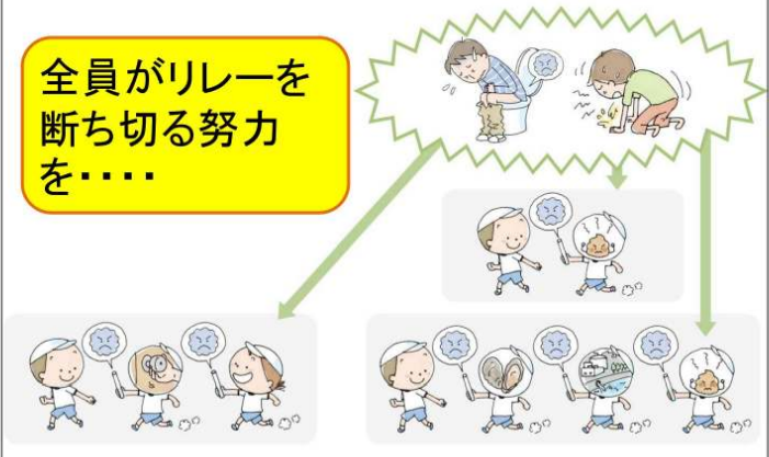
厚生労働省HPノロウイルス食中毒予防に関する説明会資料より引用