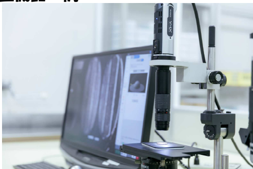
デジタルマイクロスコープ